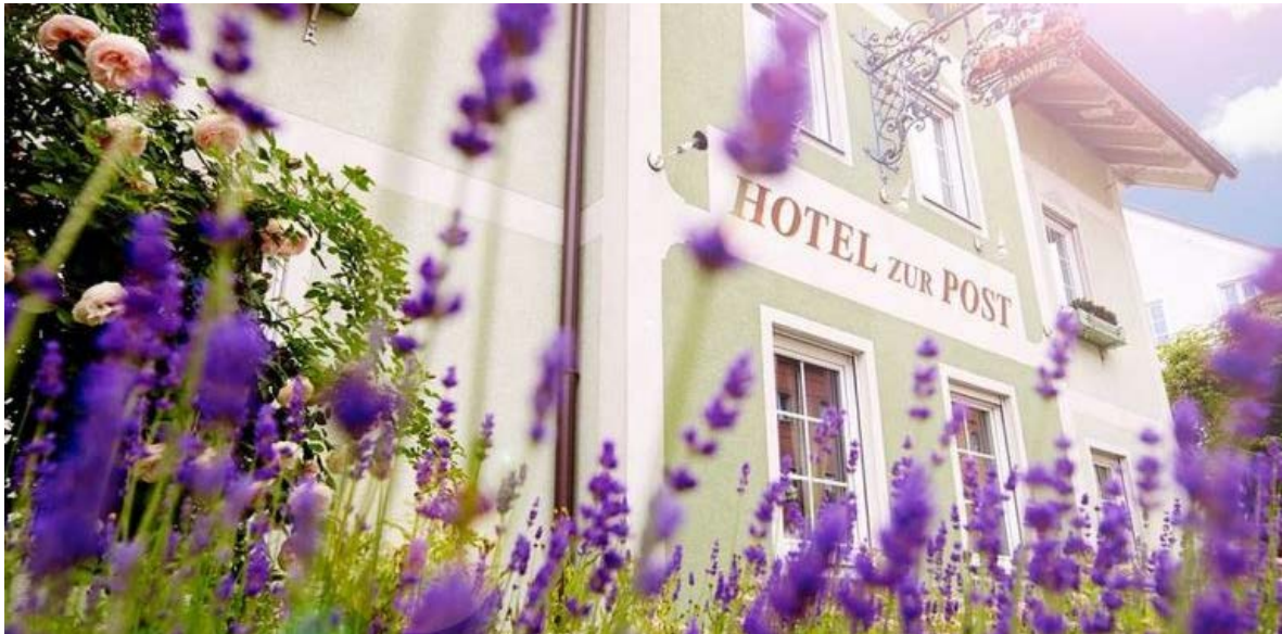
Das Grüne Hotel zur Post, Stadt Salzburg, Umweltzeichenhotel

Viele Unternehmen profitieren bereits von den Einspar- und Sanierungsmaßnahmen. Lassen Sie sich von den Good Practice-Beispielen inspirieren.