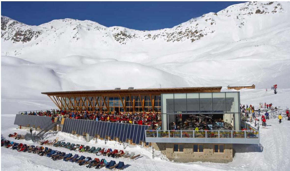
Skihütte Masner, Serfaus-Fiss-Ladis